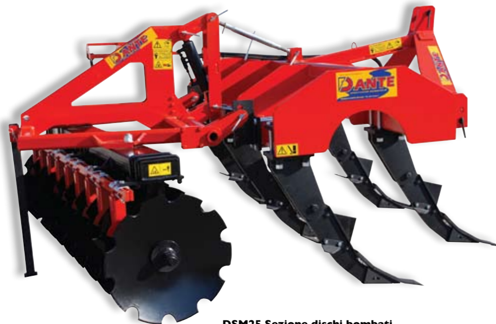
DSM25 Sezione dischi bombati DSM25 Disc section DSM25 БЛОК С ДИСКАМИ

L'agricoltura e, di conseguenza il processo di meccanizzazione agricola, devono garantire la massima produzione, sostenendo i costi in aumento della società; e, allo stesso tempo, valorizzare i fattori di produzione per economizzare le risorse ambientali. I principali effetti della lavorazione con questa tipologia di attrezzi: - decompattazione profonda del terreno senza inversione degli strati, che favorisce la formazione di sostanza organica. - eliminazione dell'eventuale suola di lavorazione prodotta da precedenti arature. - favorisce il drenaggio e il riassetto della capillarità in salita; - possibilità di operare su grandi superfici ad un'alta capacità oraria, quindi una considerevole diminuzione di consumi per ettaro.