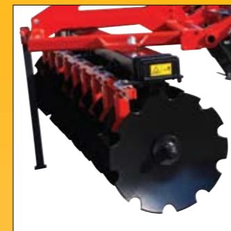
sezione dischi bombati disc section БЛОК С ДИСКАМИ