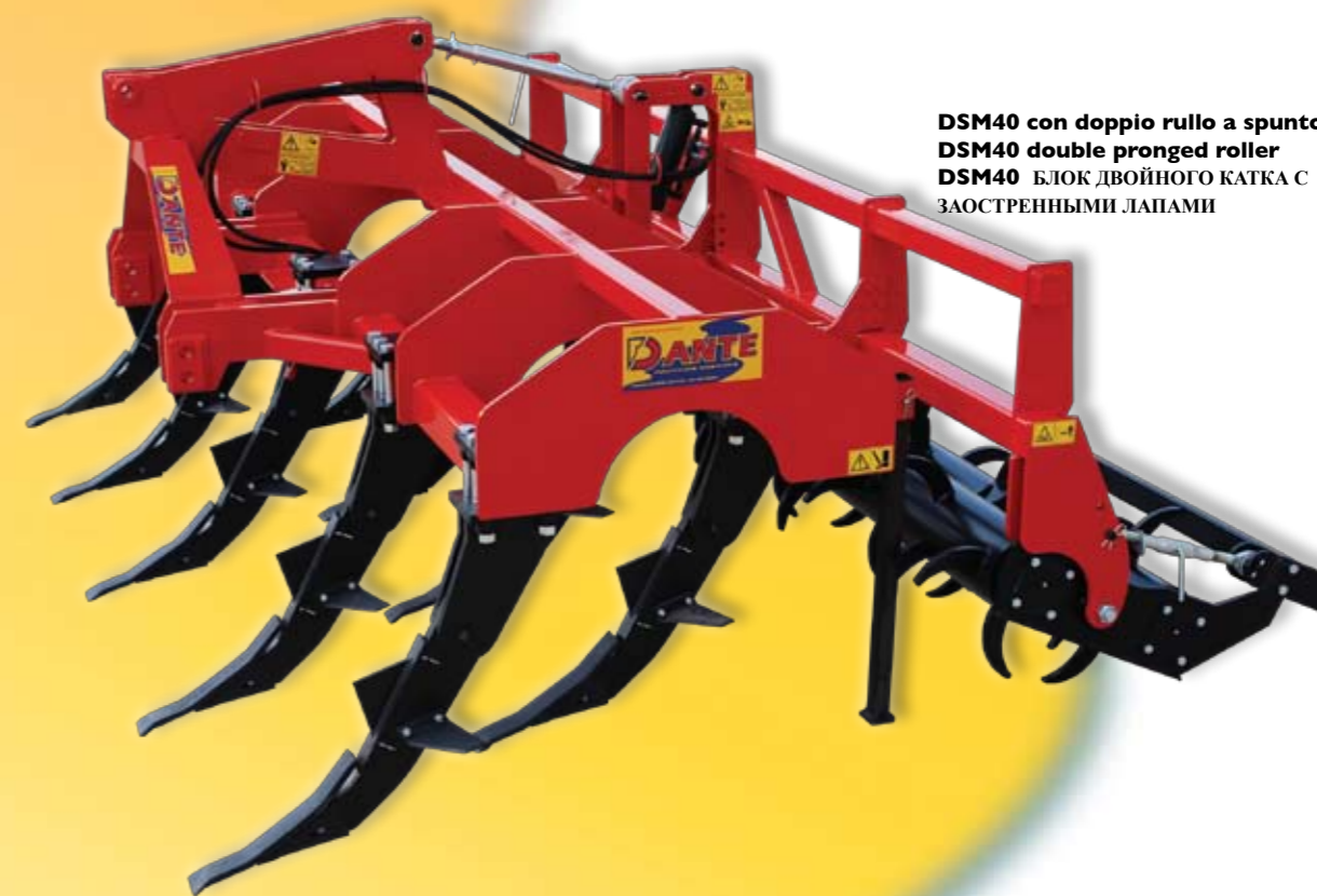
DSM40 con doppio ruolo a spuntoni DSM40 double pronged roller DSM40 БЛОК ДВОЙНОГО КАТКА С ЗАОСТРЕННЫМИ ЛАПАМИ

Четыре вида применения гарантируют универсальность в использовании в разных климатических и почвенных условиях.