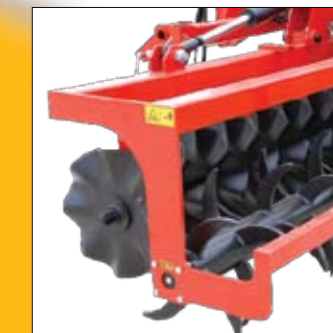
disco ruolo disc&roller БЛОК КАТКА С ЗАОСТРЕННЫМИ ЛАПАМИ И ДИСКАМИ