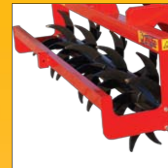
ruolo singolo a spuntoni single pronged roller БЛОК ОДИНОЧНОГО КАТКА С ЗАОСТРЕННЫМИ ЛАПАМИ